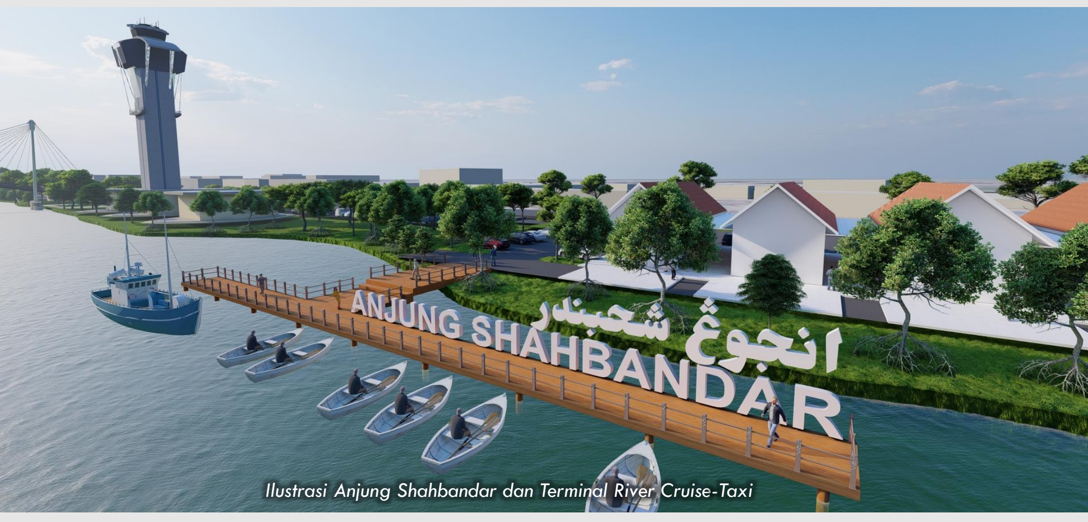
Ilustrasi Anjung Shahbandar dan Terminal River Cruise-Taxi