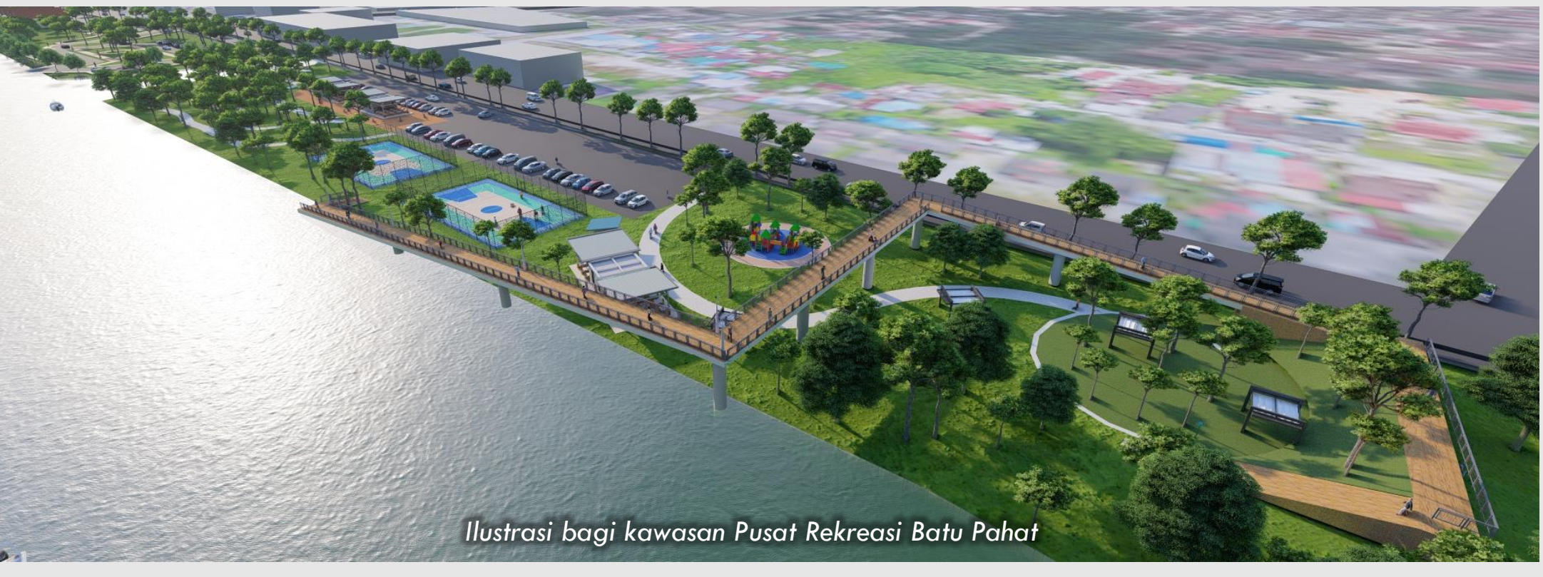
Ilustrasi bagi kawasan Pusat Rekreasi Batu Pahat