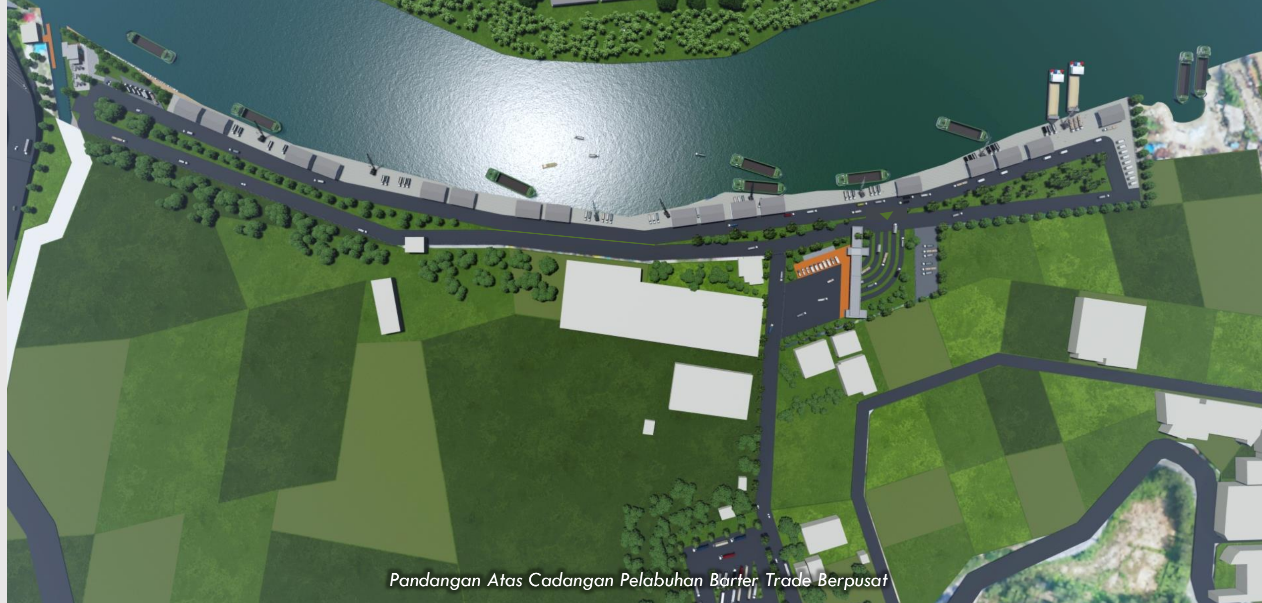
Pandangan Atas Cadangan Pelabuhan Barter Trade Berpusat