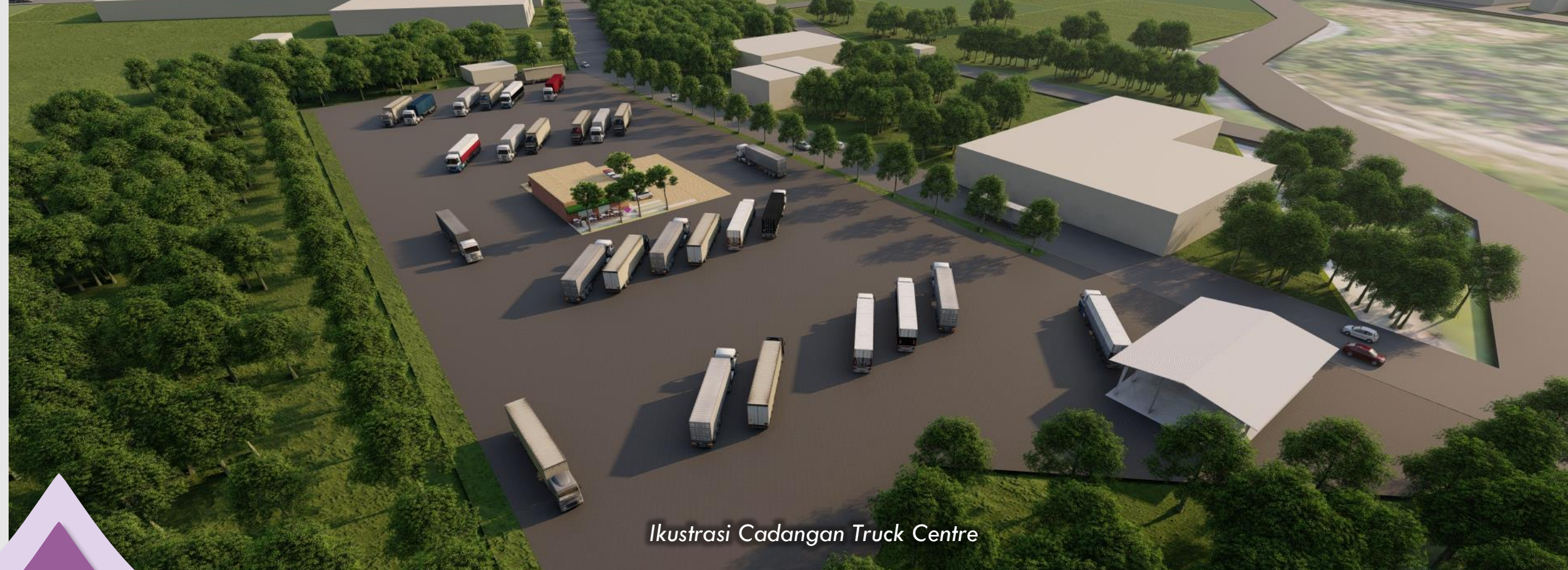
Ikustrasi Cadangan Truck Centre