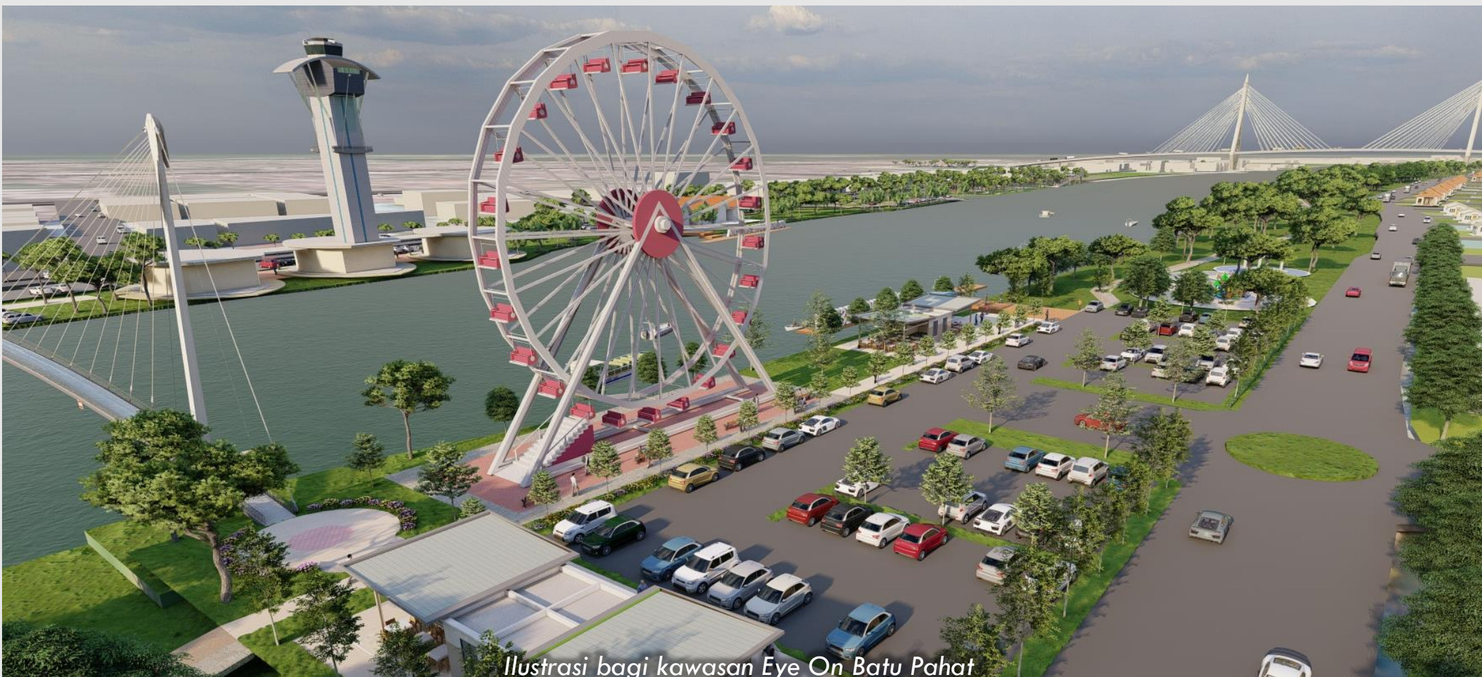
Ilustrasi bagi kawasan Eye On Batu Pahat