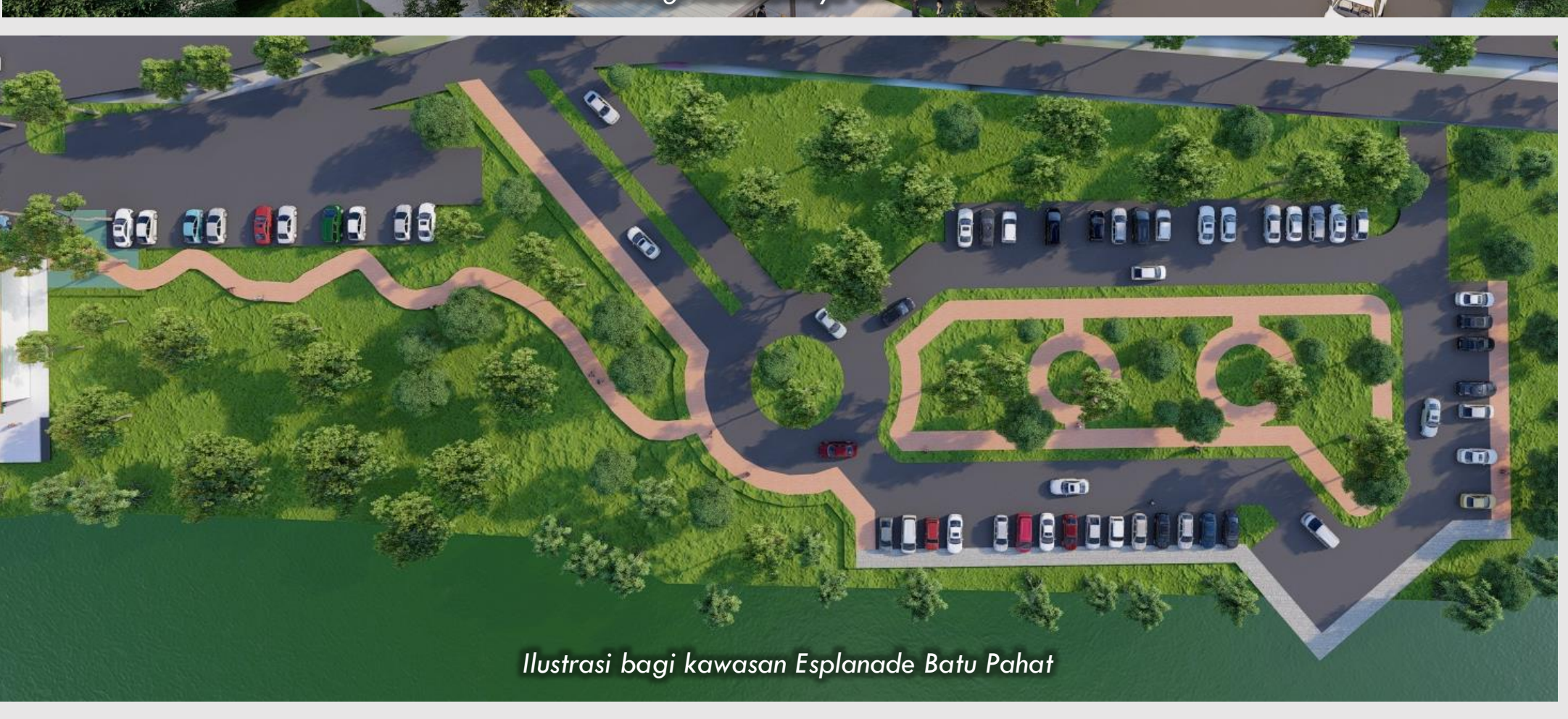
Ilustrasi bagi kawasan Esplanade Batu Pahat