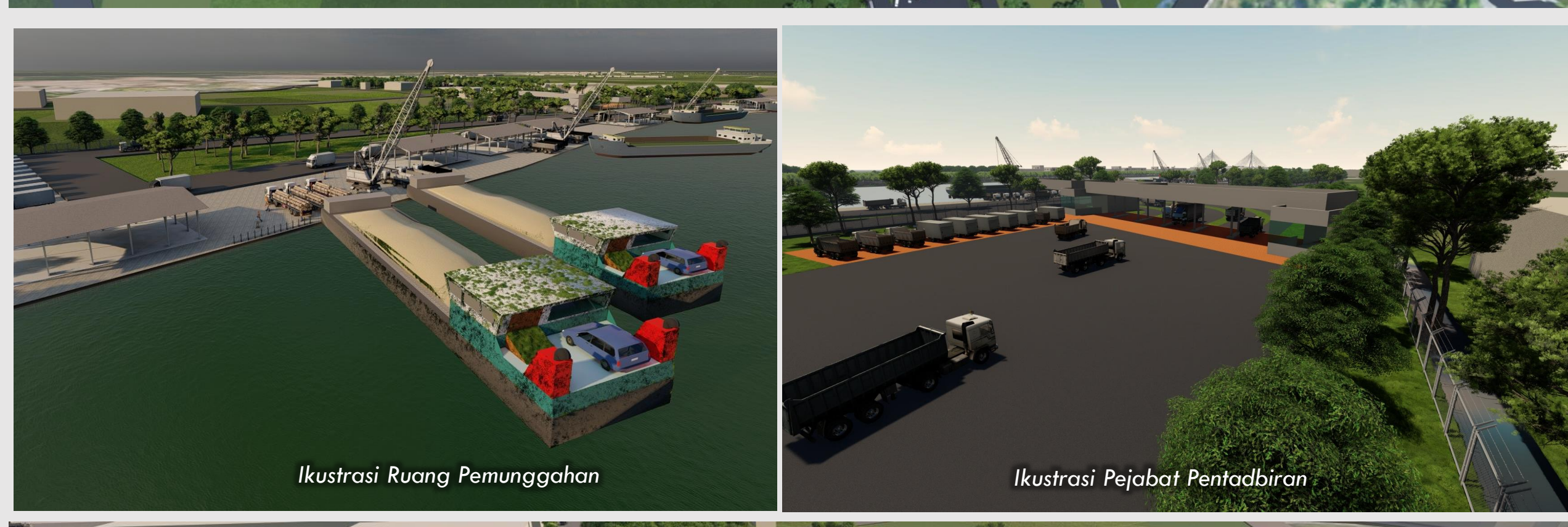
Ikustrasi Ruang Pemungghaan